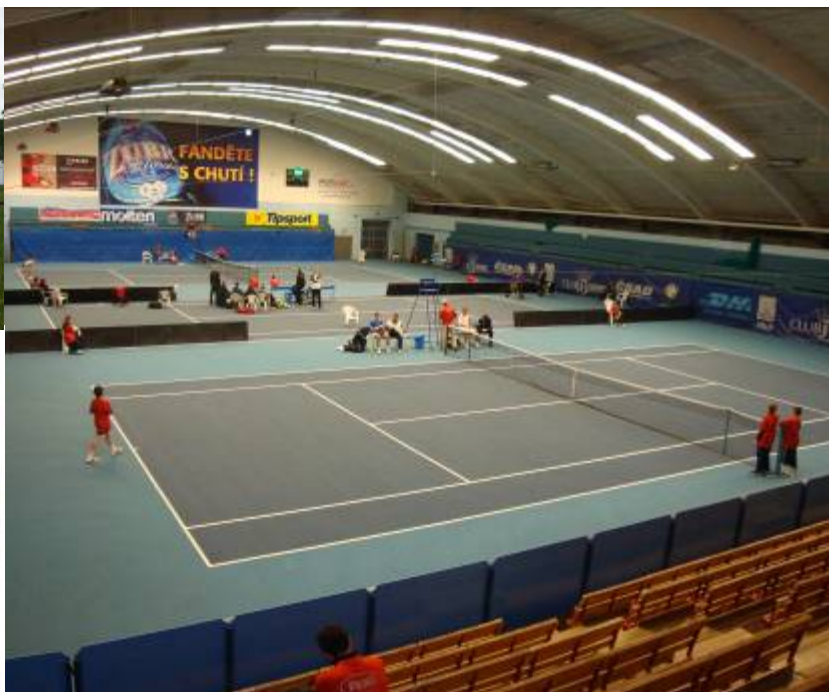
(3 hřiště povrch Courtsol Comfort)