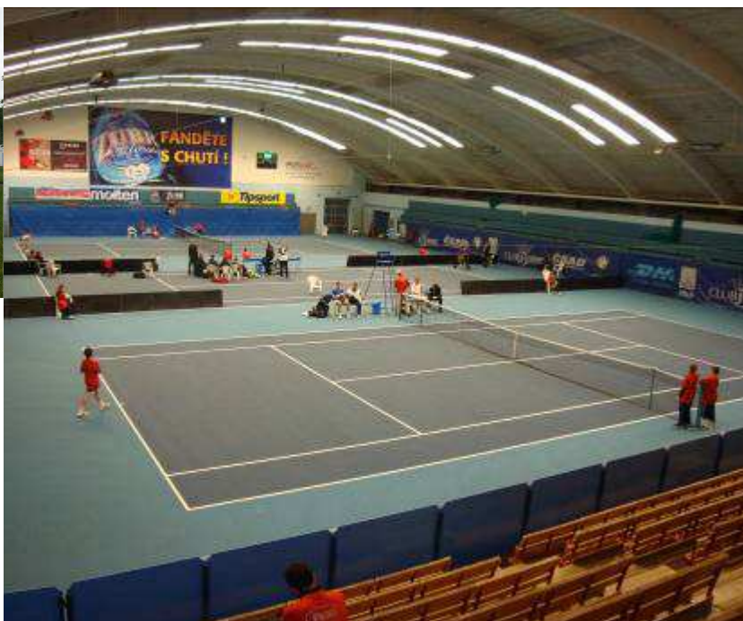
(3 hřiště povrch Courtsol Comfort)